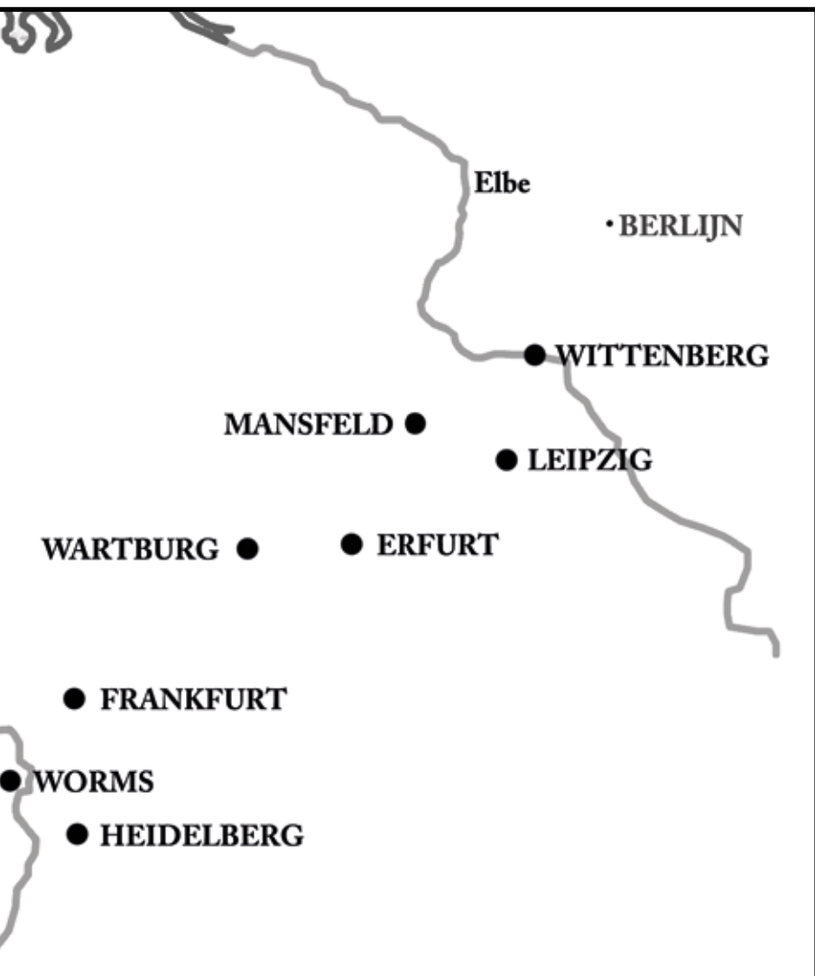
ROMEINSE RIJK IN DE TIJD VAN MAARTEN LUTHER