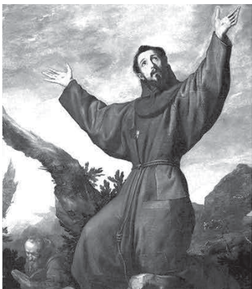
Franciscus van Assisi

In 1219 stak de onvolprezen Franciscus van Assisi (1181-1226) de ingegraven stellingen over die bij Damietta, Egypte, de legers van de kruisvaarders en de moslims scheidde. Franciscus wilde het evangelie overbrengen – of door die daad het martelaarschap verwerven – aan de Koerdische heerser en neef van Saladin, sultan Al-Kamil. Hoewel het