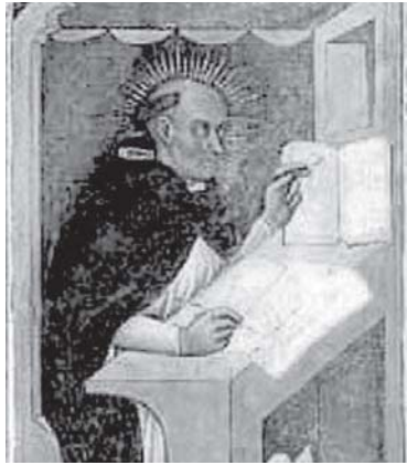
Raymundus van Peñafort

kon leren) in Barcelona en Tunis (Tunesië) en haalde zijn vriend en mede-dominicaan Thomas Aquinas over om de Summa Contra Gentiles te schrijven, een apologetisch geschrift naar zowel moslims als joden. 7 Deze bronnen