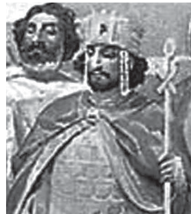
Johannes I Tzimiskes

Toen het kalifaat van de Abassiden, met het huidige Irak als middelpunt, op zijn retour was, worstelden steeds meer Arabische en Seltsjoekse emirs zich los van de overheersing door Bagdad om hun eigen, kleinere dynastieën te smeden. In het jaar 972 en opnieuw in 975 veroverde de Byzantijnse keizer Johannes I Tzimiskes gebiedsdelen aan zijn zuidgrens en een aantal steden in Syrië en Palestina. Het was in dat tijdvak tussen twee heersers dat 12.000 Arabische moslimmannen, samen met hun vrouwen en kinderen, zich lieten dopen door Byzantijnse, orthodoxe priesters. Als reden voor hun verlaten van de islam noemden ze 'de geldelijke afpersing door hun moslimleiders.' Deze door gunstige belastingen geïnspireerde beweging vond plaats bij de oude stad Nisibis (tegenwoordig de Turkse stad Nusaybin, aan de grens met Syrië). Maar in de turbulente eeuwen die volgden gingen deze dubieuze voordelen en veel andere zaken verloren door de oprukkende, Turkse moslimstammen van Anatolië. 2