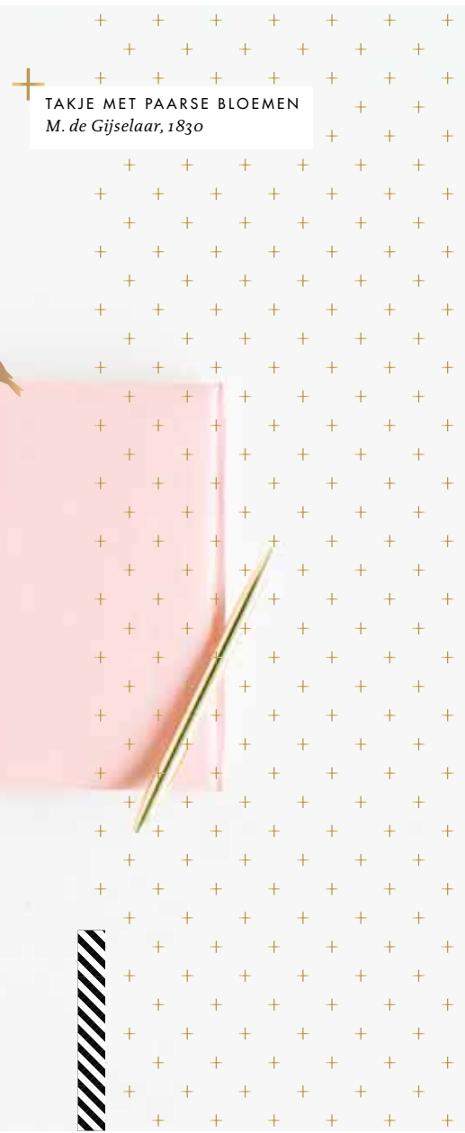
TAKJE MET PAAARSE BLOEMEN M. de Gijsselaar, 1830