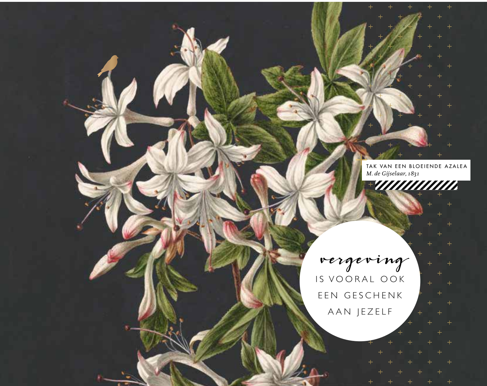
TAK VAN EEN BLOEIENDE AZALEA M. de Gijsselaar, 1831

vergeving IS VOORAL OOK EEN GESCHENK AAN JEZELF