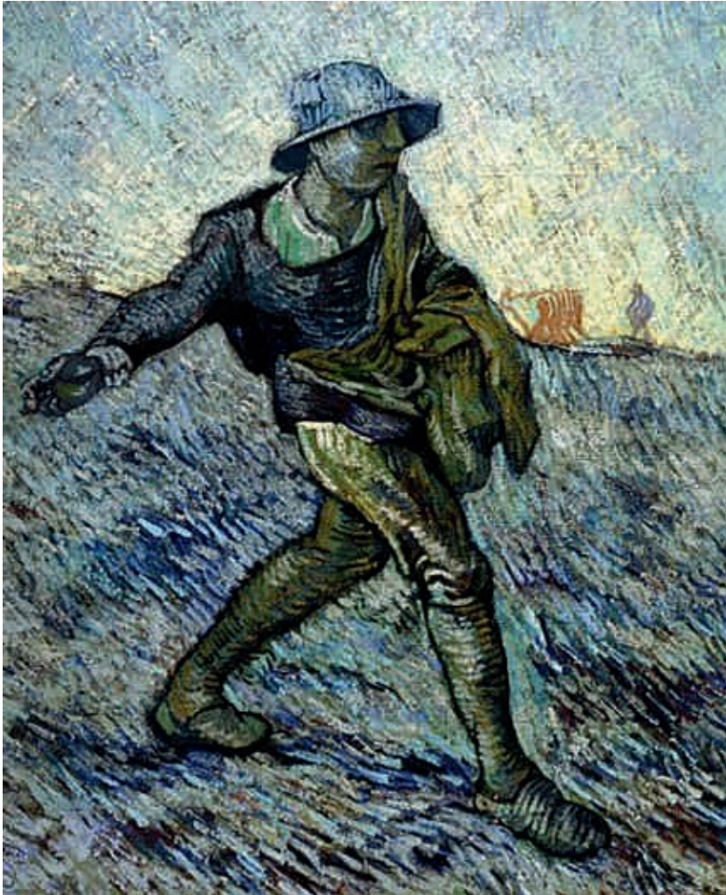
Een zaaier ging uit om te zaaien ...

11-12 klinkt het grote wonder van Gods werk door. Zo'n artikel staat zo haaks op het verstandelijk redeneren daarover. We hebben geen begripsleer, maar een geloofsleer . Die leer zal door de gelovige persoonlijk doorleefd moeten worden. Omdat wij dat geloven is de prediking onder ons Schriftuurlijk en bevindelijk.