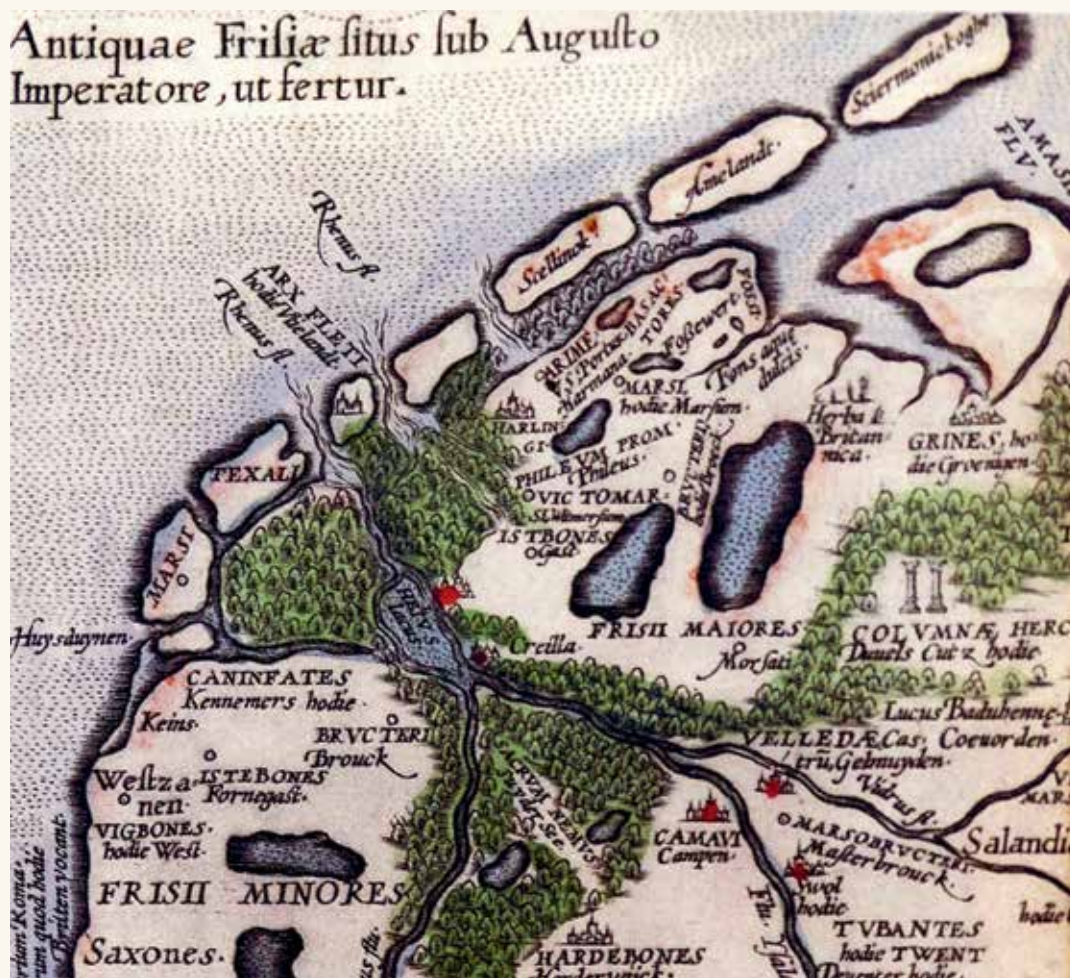
Een kaart van het door de natuur omstreden domein, zoals sommigen meenden dat het was in de tijd van keizer Augustus (63 voor Christus tot 14 na Christus).

Een wad is een modder- of zandplaat die ontstaat in een ondiepe zee. Hoe hoog ligt die plaat? Tussen het niveau in van de gangbare laag- en hoogwaterstand. Bij vloed staat de plaat dus onder water. Dan slaat doorgaans eerst het zand neer. Het zet zich af op de wadplaat. De modder komt terecht waar de minste stroming is, meestal op de grens van zee en land. Wadden kunnen door de aangroei boven het gebruikelijke vloedniveau komen te liggen. In dat geval spreken wij over kwelders of schorren. Dat gebied valt in te polderen door het aanleggen van dijken.