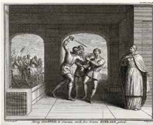
Moord op Godfried de Noorman.

Noormannen maakten het niet alleen Texelaars lastig, maar ook Wieringers. In Den Oever bevindt zich een informatiecentrum over de Noormannen. Daarin bevinden zich replica's van helmen. Vaak beelden mensen de helm van een Viking af met horens. Waarschijnlijk is dat niet altijd juist.