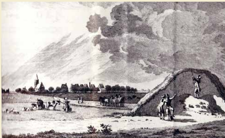
Een eeuwenoude tekening van de Sommeltjesberg.

kropen ze rond in de wijde omtrek. Dat vonden de mensen griezelig. Maar bij het afgraven van de Sommeltjesberg in 1777 vonden mensen er alleen wat Romeinse spullen. Een ketel, een wijnzeef, bijlen, een speerpunt en paardentuig. Die zullen eigendom zijn geweest van een Romeinse huurling.