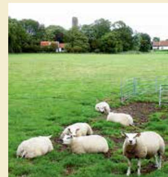
De Waal is gebouwd op een zogenoemde keileemopstuwing.

Creationisten houden vast aan de historiciteit van de Bijbelse geschiedenis van de schepping. Zij zijn ervan overtuigd dat het universum en de aarde, maar ook alle planten, dieren en de mens hun ontstaan te danken hebben aan bijzondere scheppingsdaden van God. De aarde bestaat geen miljoenen jaren. Er is wellicht een ijstijd geweest; als gevolg van de door de Bijbel gedocumenteerde zondvloed. Maar die tijd zou niet langer geduurd hebben dan 700 jaar. Job 38:29 en 30 zou een verwijzing kunnen zijn naar deze ijstijd. 'Uit wiens buik komt het ijs voort, en wie baart den rijm des hemels? Als met een steen verbergen zich de wateren, en het vlakke des afgronds wordt omvat.'