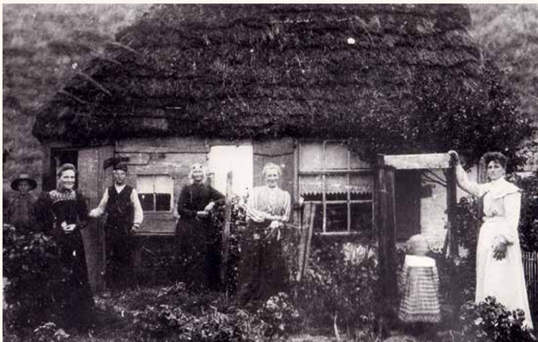
Toen zich eenmaal duinen hadden gevormd, bouwden mensen – eeuwen later – soms een hut achter die duinen.

Tot in de middeleeuwen was Wieringen – net als het Texelse gebied – verbonden aan het vasteland. Ten gevolge van een aantal stormvloedten rond het jaar 1200 werd Wieringen een eiland. Het afsluiten van geulen en zeegaten en het aanleggen van dijken maakte daar een eind aan. Vanaf 1924 was Wieringen niet meer een echt eiland.