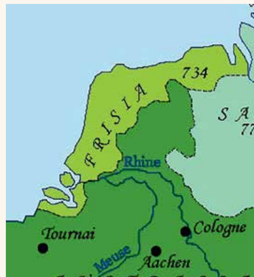
De woonstreek van de Friezen.