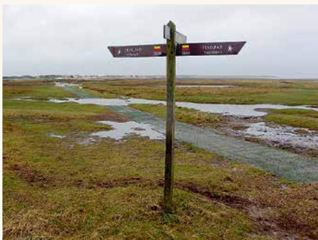
De Slufter in de eenentwintigste eeuw.