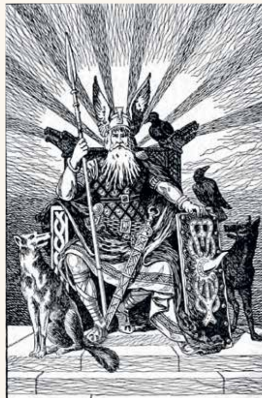
En oude afbeelding van de heidense afgod Odin.

De belangrijkste godin was Freya. Zij heette de echtgenote van Wodan. Zij gold als godin van zonneschijn en vruchtbaarheid. Zij was tevens de godin van de liefde en de wellust. Maar soms streed zij ook mee in een veldslag. Haar wagen werd getrokken door katten.