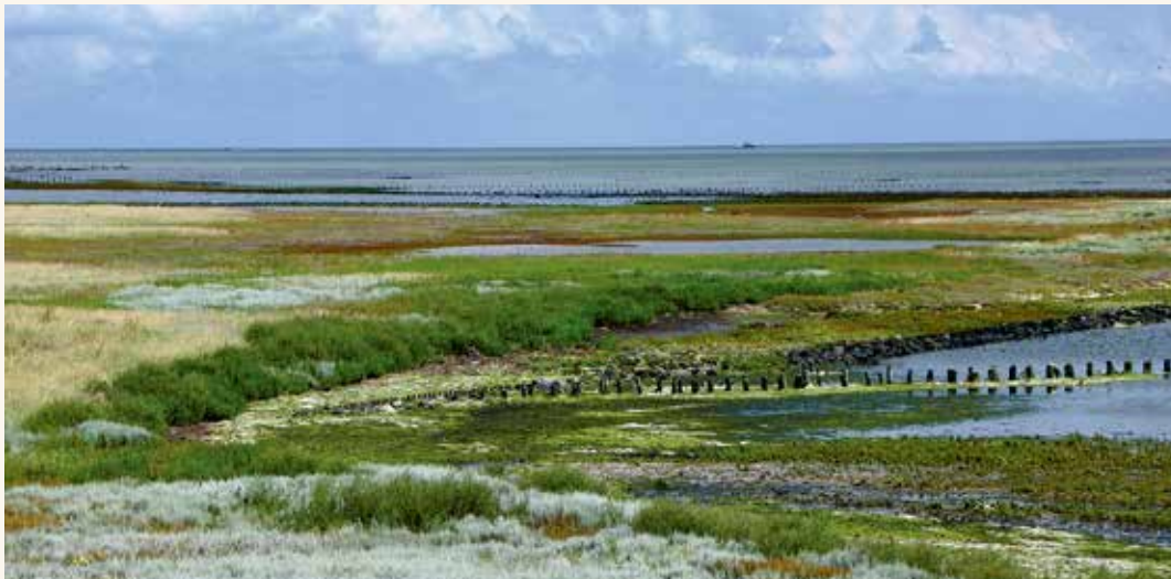
Schorren en kweldergebied anno 2018.

Die bank ligt boven het zeeniveau. Zo’n strandwal is langgerekt en vaak enkele meters hoog. Zij ligt evenwijdig aan de kust, of vormt zelf een soort kustlijn. Rond 1000 voor Christus moeten in het noorden van het latere Nederland strandwallen zijn ontstaan. Die strandwallen vormden niet een aaneengesloten, lang geheel. Ze waren onderbroken door getijgeulen. Die kwamen uit in een achter de wallen liggend veen-, schorren- en kweldergebied: het wad. Eb en vloed zorgden er telkens voor