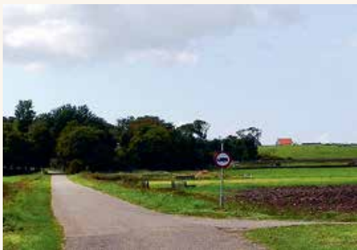
De Hoge Berg

In de loop van de zestiende eeuw verzandde het Anegat. Maar er gebeurde nog meer. Tussen Texel en Eierland groeide aan de zee kant een hoge strandvlakte. In 1630 legden harde werkers daar een zanddijk aan. Zo raakten die twee eilanden, Eierland en Texel, met elkaar verbonden. In 1835 nam