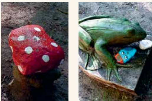
Langs het Sommeltjespad.

‘eersteklas’ bronnen over het heidendom op Texel.