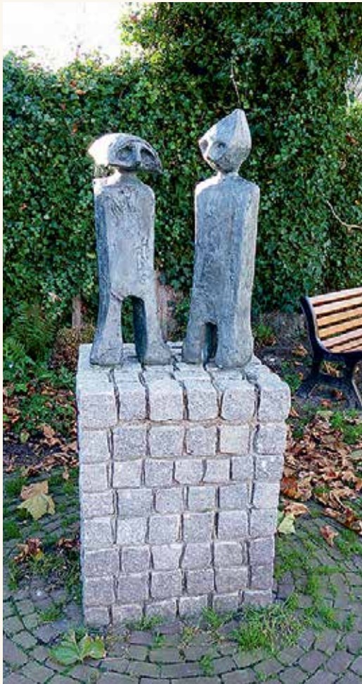
In de Waal staat zelfs, vlak bij de dorpskerk, een monumentje voor de sommeltjes.