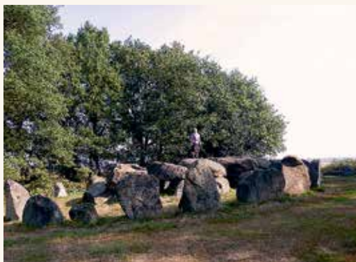
Op Texel begroeven de nabestaanden de doden in grafheuvels. In Drenthe moeten de mensen hunebedden hebben gebruikt als graf.

De Bataven waren vermoedelijk een stam van West-Germaanse afkomst. Zij werden genoemd door Romeinse schrijvers als Julius Caesar, Tacitus en Suetonius. Tacitus vertelde dat de Bataven woonachtig waren rond de grote rivieren in de Laaglandse delta. Dus het rivierengebied. Caesar noemde de Bataven terloops in zijn commentaar op de Gallische oorlog. Zij zouden op een eiland wonen, waar de Maas en de Waal bij elkaar kwamen. Doorgaans situeert men het land van de Bataven in het huidige Zuid-Holland. Soms ook wel in het Gelders rivierengebied. In de buurt van Nijmegen.