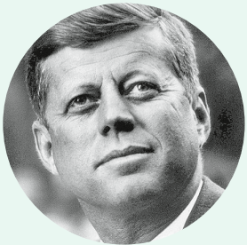
JOHN F. KENNEDY | President van de Verenigde Staten van 1961 - 1963

”Want Israël is niet gemaakt om te verdwijnen - Israël zal blijven bestaan en bloeien.”