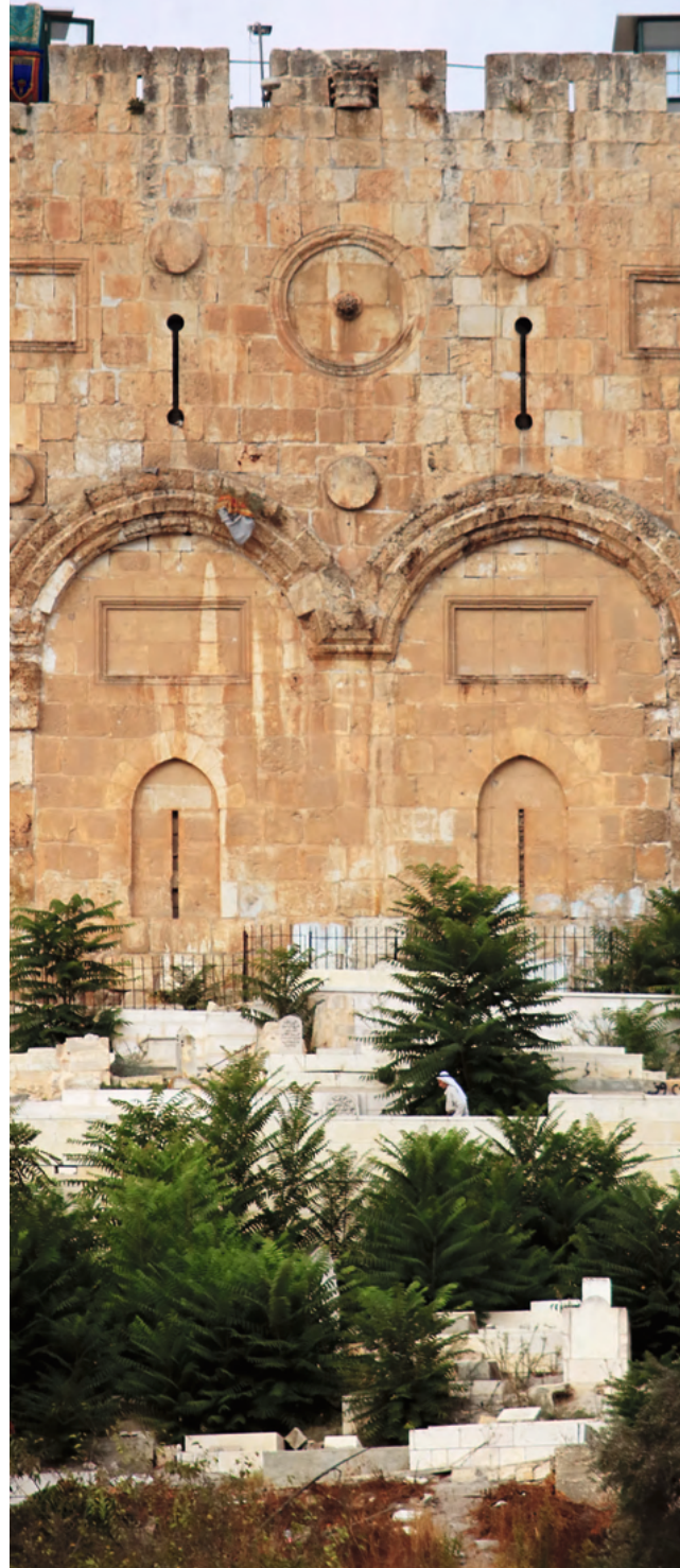
Foto: dichtgemetselde Gouden Poort

Wat speelde zich nog meer af bij de tempel?