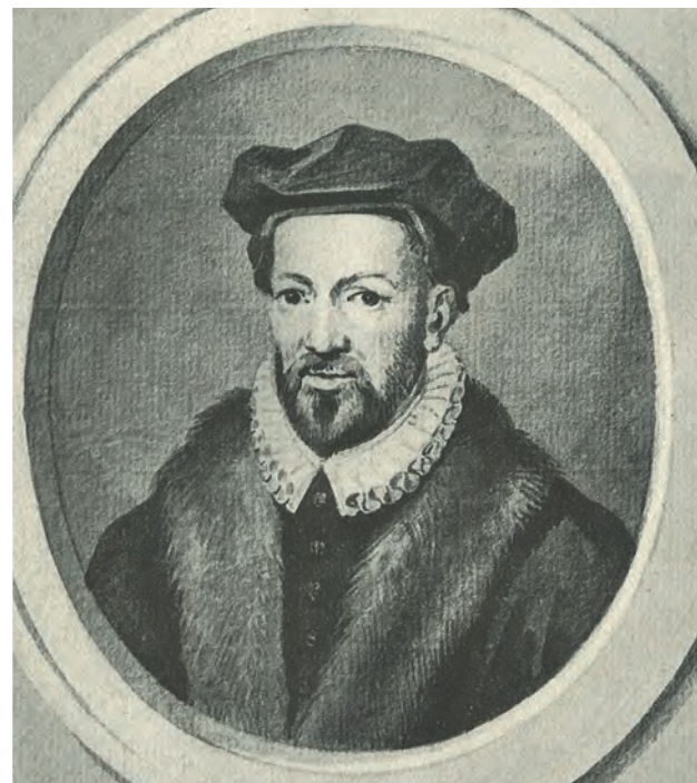
Guido de Brès, die de Nederlandse Geloofsbelijdenis opstelde, is evenals Petrus Datheen werkzaam geweest in de omgeving van Horebeke

de Rooms-Katholieke Kerk verzetten en deze verlie- ten. Met dreiging en geweld moesten de afvalligen teruggebracht of bestraft worden. De aanhangers van de nieuwe leer werden vervolgd en als ze vast- hielden aan hun overtuiging, werden ze gedood. Velen zijn in die tijd op de brandstapel gestorven. Trouwens, in heel Europa werden godsdienstoorlo- gen gevoerd, waarbij duizenden slachtoffers vielen. Koning Filips II gaf de hertog van Alva de opdracht om de protestanten terug te brengen naar de moe- derkerk en te voorkomen dat hun aantal uitbreidde.