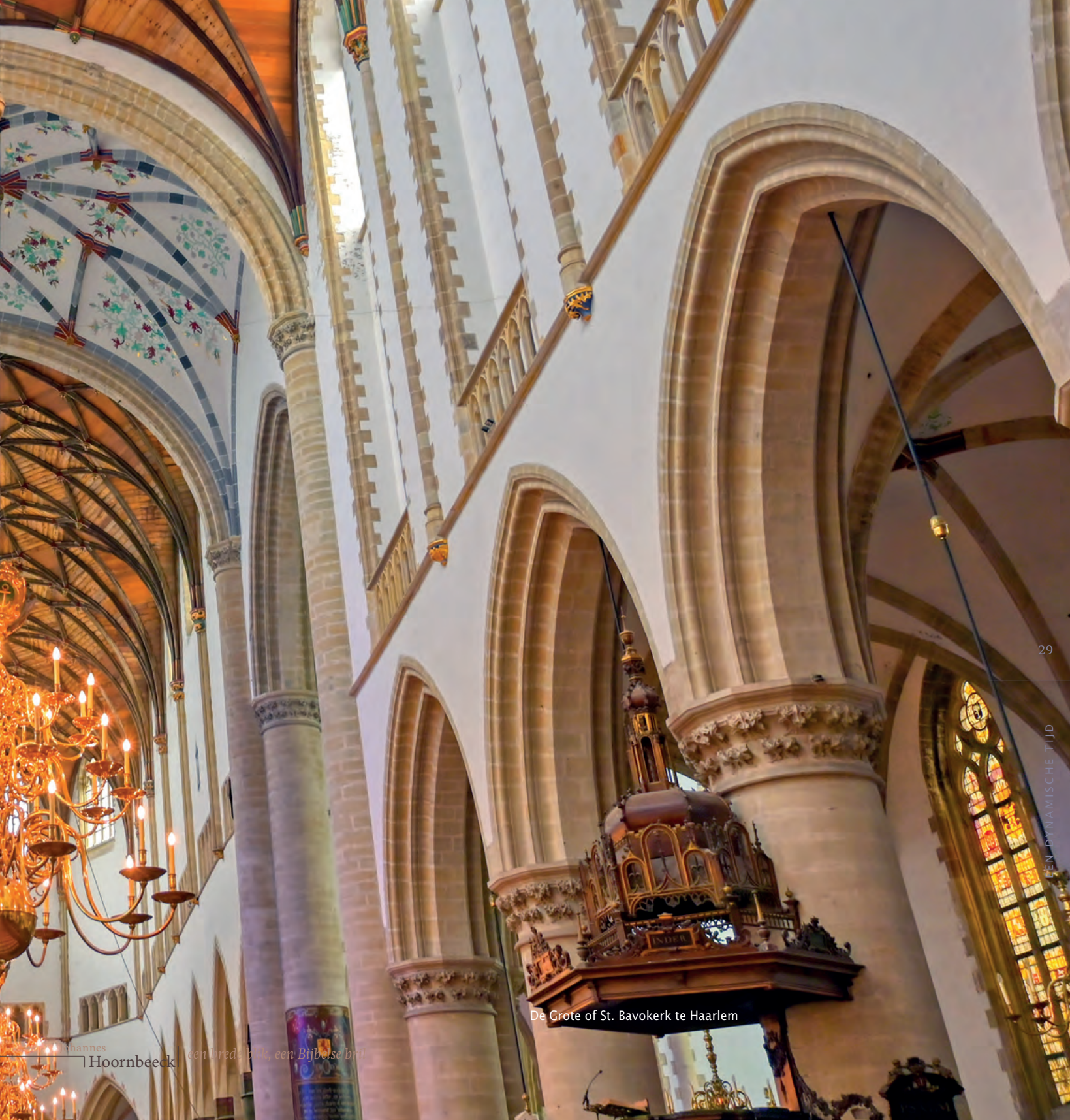
De Grote of St. Bavokerk te Haarlem