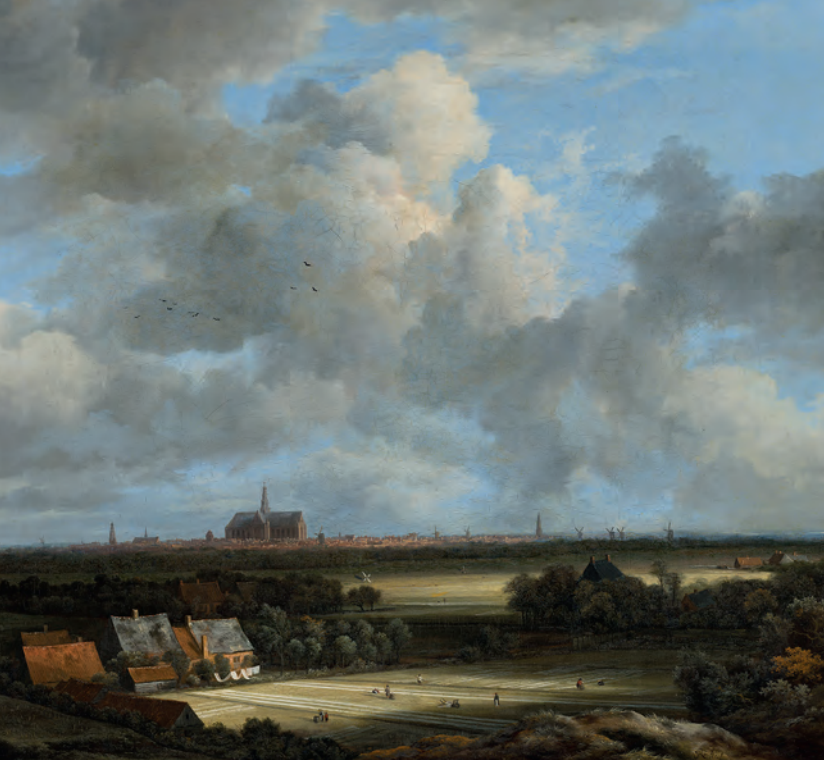
De bleekvelden van Haarlem waar linnen werd 'gebleekt', wit gemaakt

dan een halve eeuw van 18.000 naar bijna 40.000 in 1620. Bij de volkstelling van 1621 bestond meer dan de helft van de inwoners uit mensen van niet-Haarlemse afkomst. De stad moest uitgebreid worden. Die grote groep immigranten had onderdak nodig. Uitbreiding van een stad in die tijd was niet zo simpel. Steden waren namelijk uit veiligheidsoverwegingen ommuurd. De ruimte binnen die muren was beperkt. Een groot deel van de geloofsvluchtelingen sloot zich aan bij de calvinistische kerk. Tussen 1580 en 1586 was meer dan 50% van de lidmaten van die gemeente afkomstig uit de Zuidelijke Nederlanden. 7 Tobias en Janneke, de ouders van Johannes, waren wel echte Haarlemmers. Toen Johannes geboren