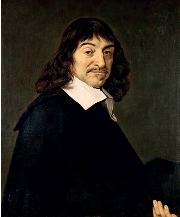
Descartes. Zijn denkbeelden betekenden een ommekeer in het denken

roemde schilder Frans Hals (1582-1666). Toen hij vier jaar was, vertrokken zijn ouders uit Antwerpen en vestigden zich in Haarlem. Zijn vader was wever en lakenkoopman. Hij zal dus volop werk gevonden hebben in de groeiende textielindustrie van Haarlem. Zoon Frans heeft zijn hele leven in die stad gewoond en gewerkt. Hij werd een van de meest bekende schilders van ons land, die vooral bekendheid kreeg door de vele schuttersstukken. Daarop waren de leden te zien van stedelijke schutterijen, groepen burgers die de taak hadden om hun stad te verdedigen tegen bijvoorbeeld rondzwervende groepen militairen of roversbenden. Ze werden ook wel ingezet als het in de stad zelf rumoerig was. Daarnaast schilderde hij portretten van veel tijdge-