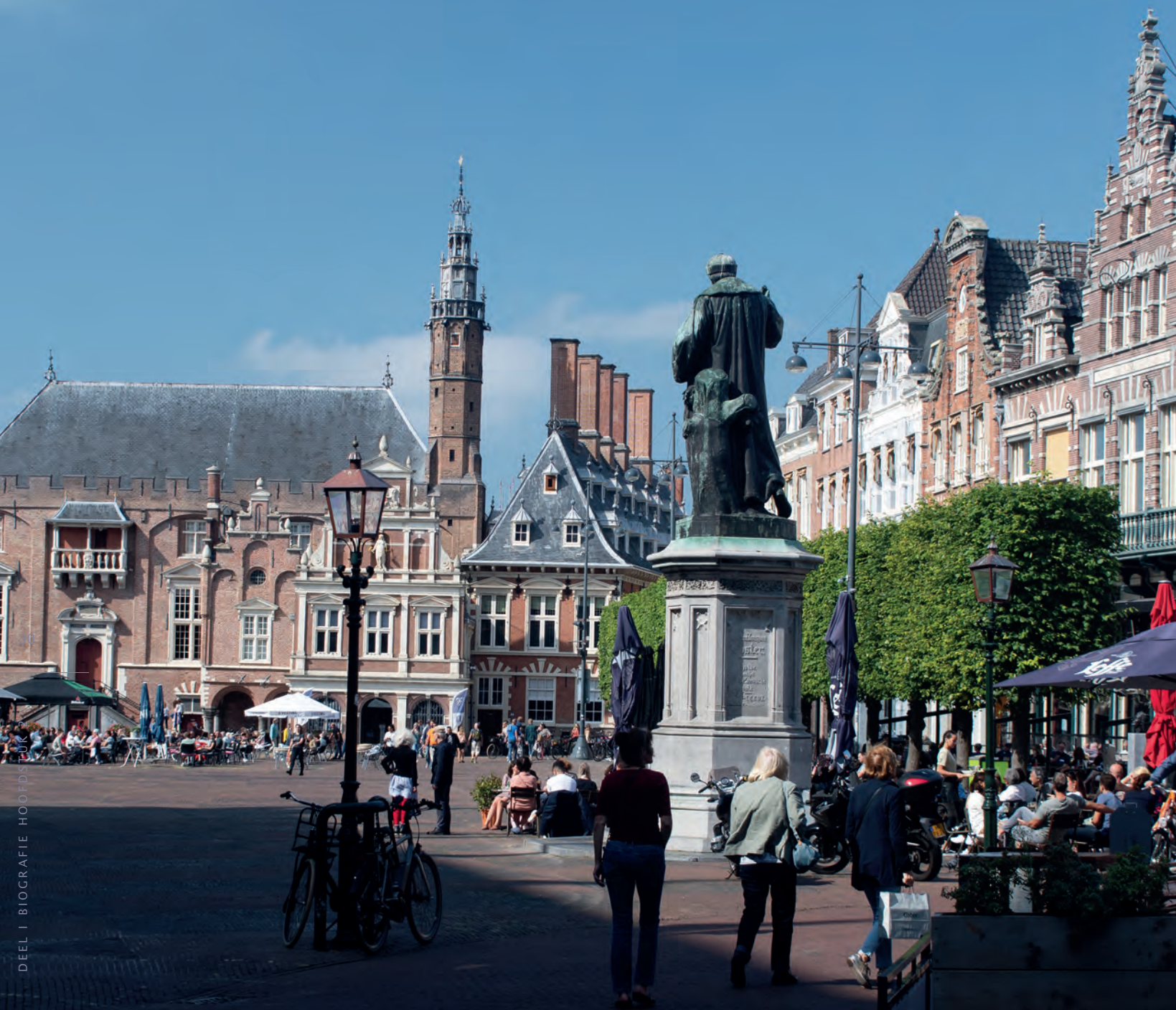
Het stadhuis in Haarlem. Op de voorgrond het standbeeld van Laurens Jansz. Coster