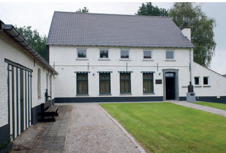
Het archief in Horebeke

van het confessionele naar het rationele denken. Daardoor was de nieuwe denkmethode onverenigbaar met de godsdienstige en door de kerk erkende grondslag van het traditionele gezag, denken en geloof. 9 Er werd in die tijd veel geschreven over de verschillende zienswijzen en gediscussieerd tussen de voorstanders van het nieuwe denken en hen die wilden vasthouden aan de oude uitgangspunten. Dat gebeurde met de nodige scherpste en felheid. Een van de grote bestrijders van de nieuwe filosofie was Voetius (1589-1676), de leermeester en later collega van Hoornbeeck. Door tijdgenoten werd Voetius zelfs tot de voornaamste tegenstanders in Noord-Europa gerekend. 10 De vroege verlichting, waar Descartes toe gerekend kan worden, betekende een aanval op de fundamenteën van de eeuwenoude manier van wetenschap bedrijven en denken.