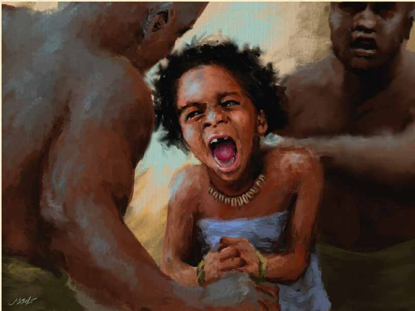
Phillis werd in 1760 gekidnapt, waarschijnlijk door Afrikanen die werden betaald door Europese handelaren.