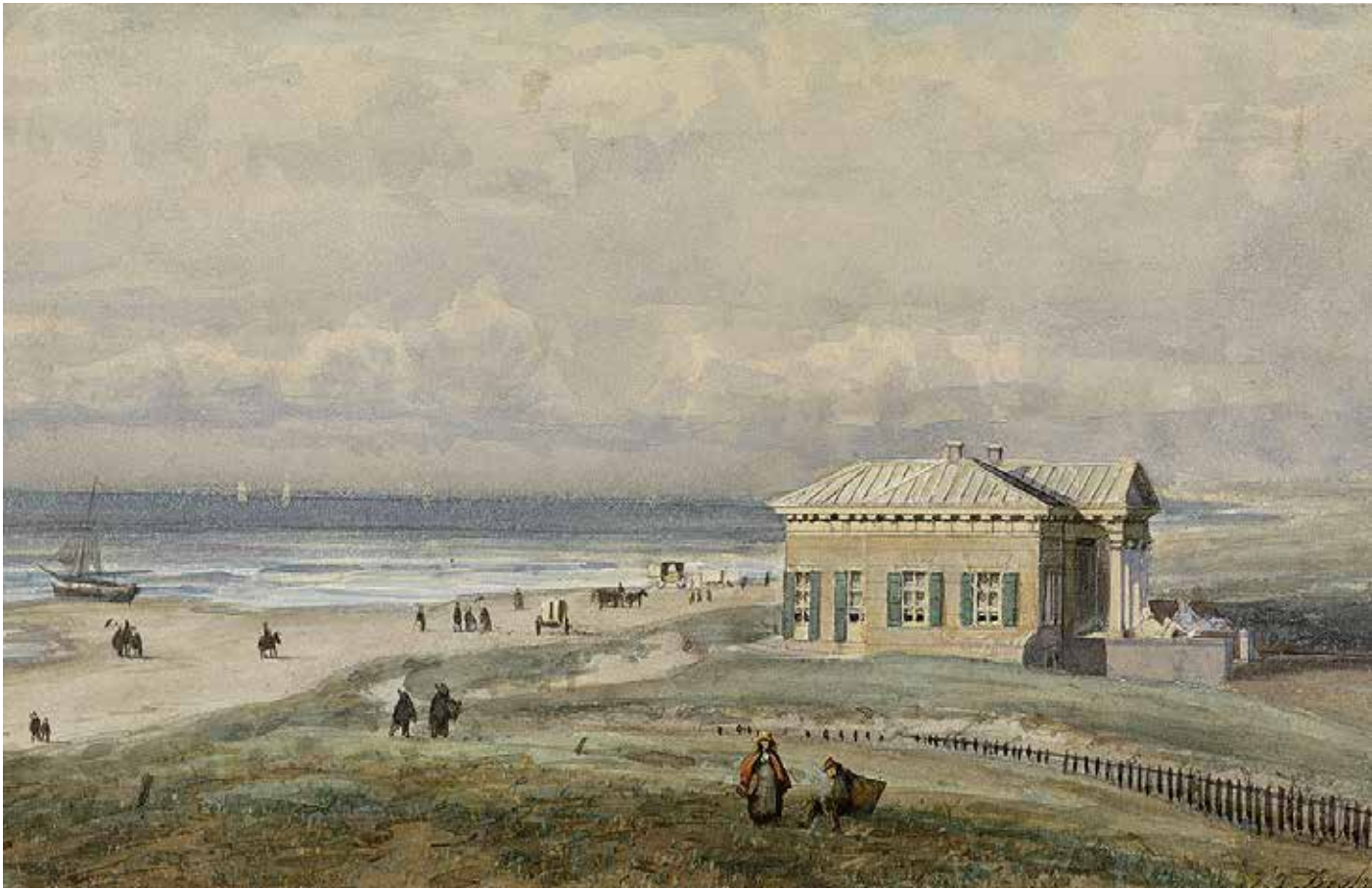
Koninklijk Paviljoen (nu 'Paviljoen Von Wied') in Scheveningen. Een geschenk van koning Willem I aan zijn echtgenote koningin Wilhelmina, 1877. Schilderij, Johannes Josephus Destree (1827-1888). Rijksmuseum Amsterdam.