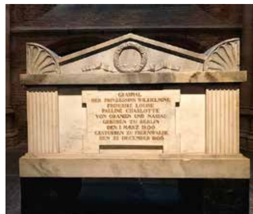
In de Nieuwe Kerk in Delft staat het grafmonument voor prinses Pauline, dochter van koning Willem I en koningin Wilhelmina. Dit monument is afkomstig van haar oorspronkelijke graf in Freienwalde (Duitsland) waar zij in 1806 is begraven.

Op 12 oktober overlijdt ze op Paleis Noordeinde. Haar lichaam krijgt op 26 oktober een plaats in de koninklijke grafkelder in Delft. De herdenkingsdienst, met hofprediker Isaäc Dermout als voorganger, wordt op de daaropvolgende zondag 29 oktober 1837 in de Kloosterkerk in Den Haag gehouden.