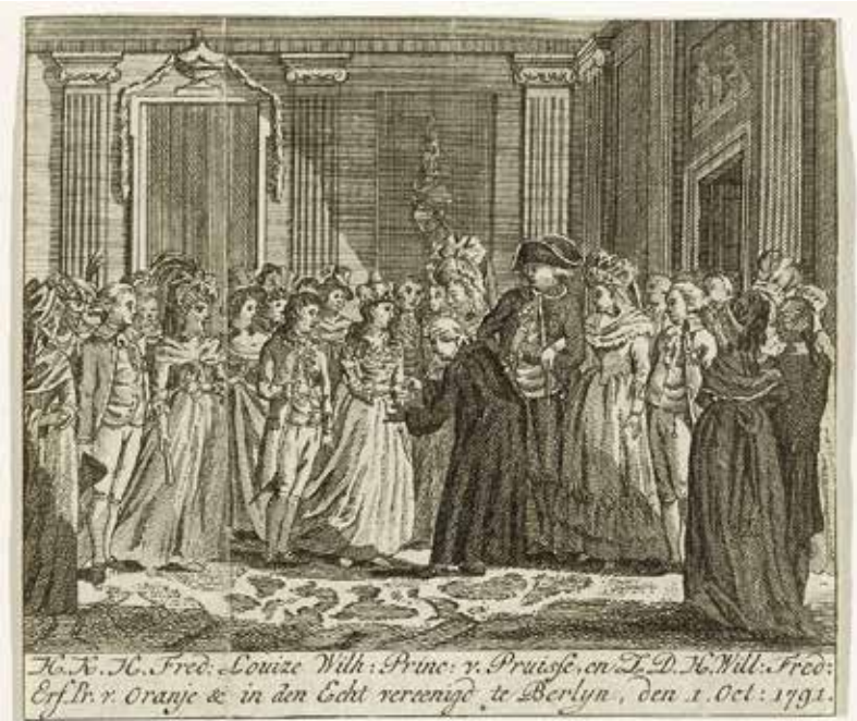
Huwelijkssluiting op 1 oktober 1791 in de Witte Zaal van het Stadtschloss in Berlijn, tussen erfprins Willem Frederik (de latere koning Willem I) en prinses Wilhelmina van Pruisen.

Mimi brengt een groot deel van haar jeugd in Berlijn door. Ze is kunstzinnig, muzikaal, speelt graag toneel en kan goed schilderen. Als Mimi zestien jaar oud is, wordt ze uitgehuwelijkt aan de Nederlandse erfprins Willem Frederik, de latere koning Willem I. Op 1 oktober 1791 treedt ze met hem in het grote stadspaleis in Berlijn in het huwelijk. Aansluitend volgt daar een bruiloftsfeest dat maar liefst zeventien dagen duurt. Daarna vertrekt het jonge paar naar Den Haag. Op 2 november 1791 wordt het paar daar feestelijk binnenge-