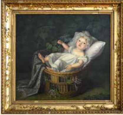
Prinses Marianne in de wieg. Geschilderd in 1811 door haar moeder, Wilhelmina van Pruisen. Muzeum Powiatowe w Nysie (Polen), 2019.

favoriete thema's. In de periode na 1814 komt de bekende Pruisische hofschilder Friedrich Bury uit Berlijn naar Brussel en Den Haag om haar les te geven.