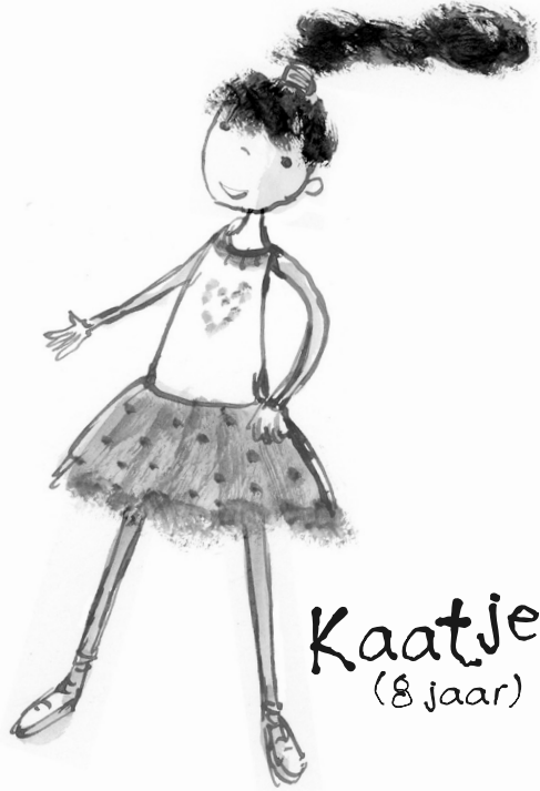
Kaatje (8 jaar)