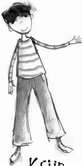
Krijn (7 jaar)