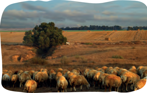
Kleinvee (Genesis 4:2)

2 En zij baarde opnieuw: zijn broer Abel. Abel werd herder van kleinvee en Kain werd bewerker van de aardbodem.