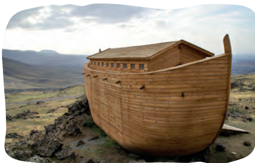
Ark (Genesis 7:1)

7 Daarna zei de HEERE tegen b Noach: Ga in de ark, u en heel uw gezin, want Ik heb gezien dat c u te midden van uw tijdgenoten voor Mijn aangezicht rechtvaardig bent.