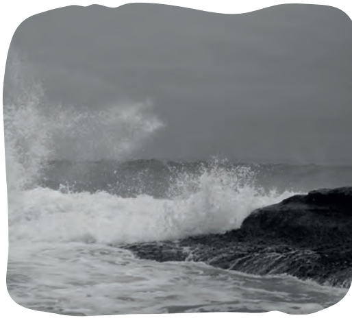
Het droge zichtbaar (Genesis 1:9)

13 Toen was het avond geweest en het was morgen geweest: de derde dag.