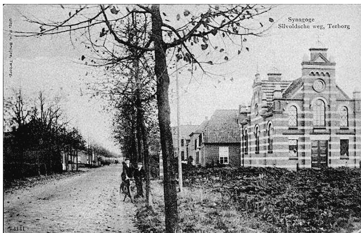
De synagoge aan de Silvoldseweg in Terborg, Ansichtkaart uit 1903.