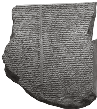
Het elfde tablet van het Gilgamesj-epos, met daarop het Babylonische vloedverhaal.

De oude Babyloniërs stelden hun vloedverhaal op schrift in het zogenaamde Gilgamesj-epos; een op kleitablet vastgelegd heldendicht. Het beschrijft hoe Ea, de god die de mens geschapen had, een man genaamd Utnapishtim opdroeg een ark te gaan bouwen in de vorm van een kubus, omdat er een vloed zou gaan komen. 9 Utnapishtim bouwde de ark en ging aan boord met dieren, familie en nog enkele mensen. Toen de vloed losbarstte, was deze zo angstaanjagend dat zelfs de goden bang werden en berouw kregen van hun keuze. De vloed duurde een week lang, waarna de ark terechtkwam op de berg Nisir. Utnapishtim zond