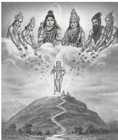
De zeven rishi's die met Manu de vloed overleefd hebben, afgebeeld boven de berg vanwaar zij de aarde opnieuw bevolkten.

Slechts één thema zien we terug op ieder continent, in alle gebieden, en onder ieder volk: de wereldwijde vloed.