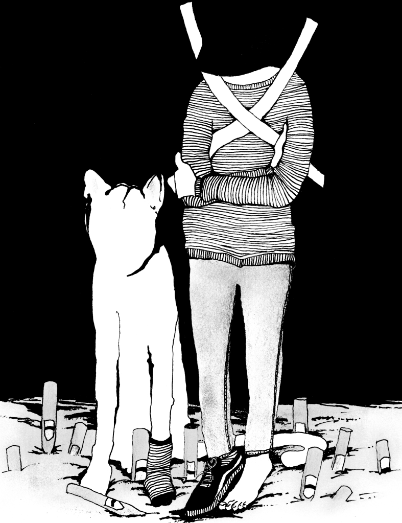
Neeltje in de vallei met de orgelpijpjes, pg. 106