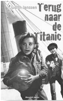
Terug naar de Titanic