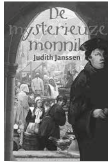
De mysterieuze monnik