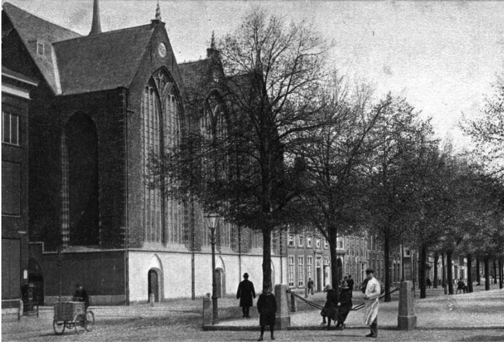
Kloosterkerk aan de Lange Voorhout in Den Haag. Prentbriefkaart uit 1904.