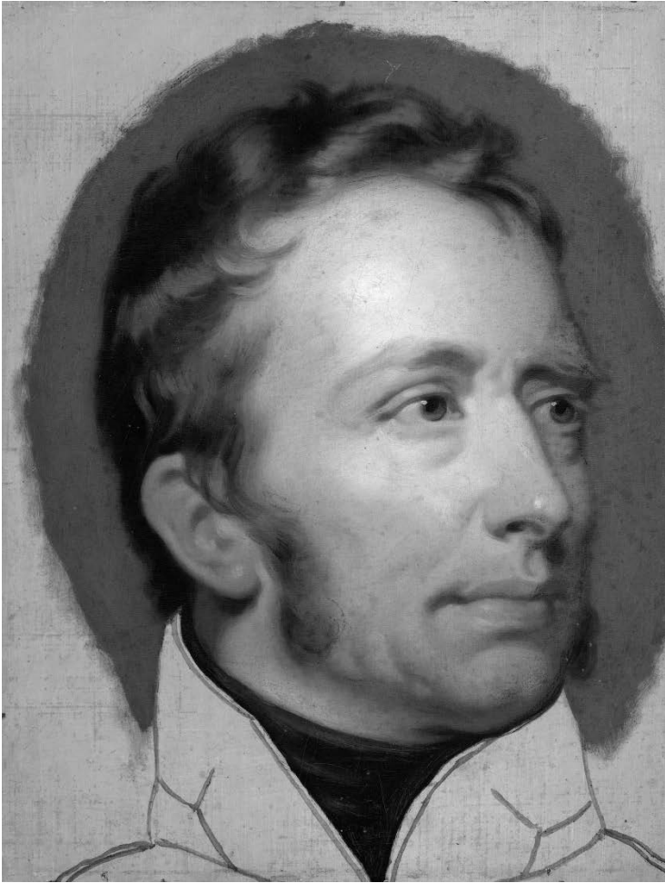
Koning Willem I der Nederlanden (1772-1843). Voorstudie voor het portret van 1816 voor het Amsterdamse stadhuis, door Charles Howard Hodges.