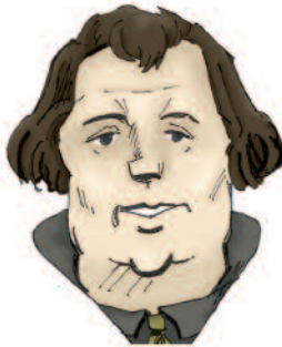
MAARTEN LUTHER (1483-1546) PROFESSOR NIEUWE TESTAMENT