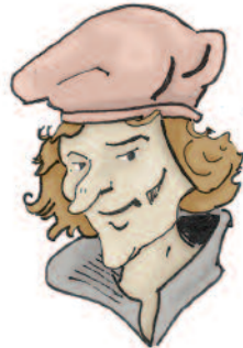
GEORG SPALATINUS (1484-1545) GOUVERNEUR EN ADVISEUR VAN FREDERIK III