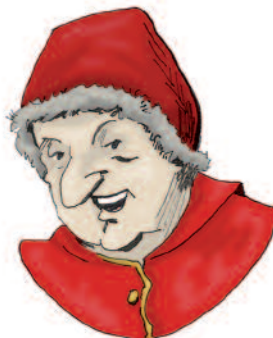
PAUS LEO X (1475-1521) LIT HET GESLACHT DE MEDICI