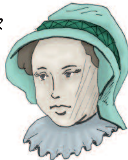
KATHARINA VON BORA (1499-1552) VROUW VAN LUTHER