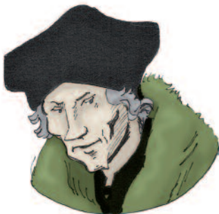
DESIDERIUS ERASMUS (1466-1536) NEDERLANDSE THEOLOOG EN HUMANIST