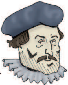
ANDREAS BODENSTEIN (1486-1541) PROFESSOR KERKGESCHIEDENIS