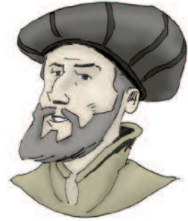
KEIZER KAREL V (1500-1558) MACHTHEBBER VAN HET GROOTSTE EUROPESE RIJK.