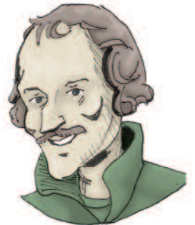
PHILIPP MELANCHTHON (1497-1560) PROFESSOR GRIEKS