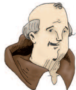
JOHAN VON STAUPITZ (1465-1524) BIECHTVADER VAN LUTHER