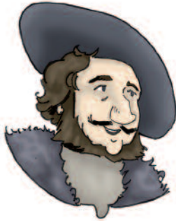
FREDERIK III VAN SAKSEN (1463-1525) LANDSVORST VAN SAKSEN, BIJGENAAMD DE WIJZE