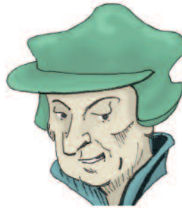
THOMAS MÜNTZER (1489-1525) PREDIKANT EN REVOLUTIONAIR