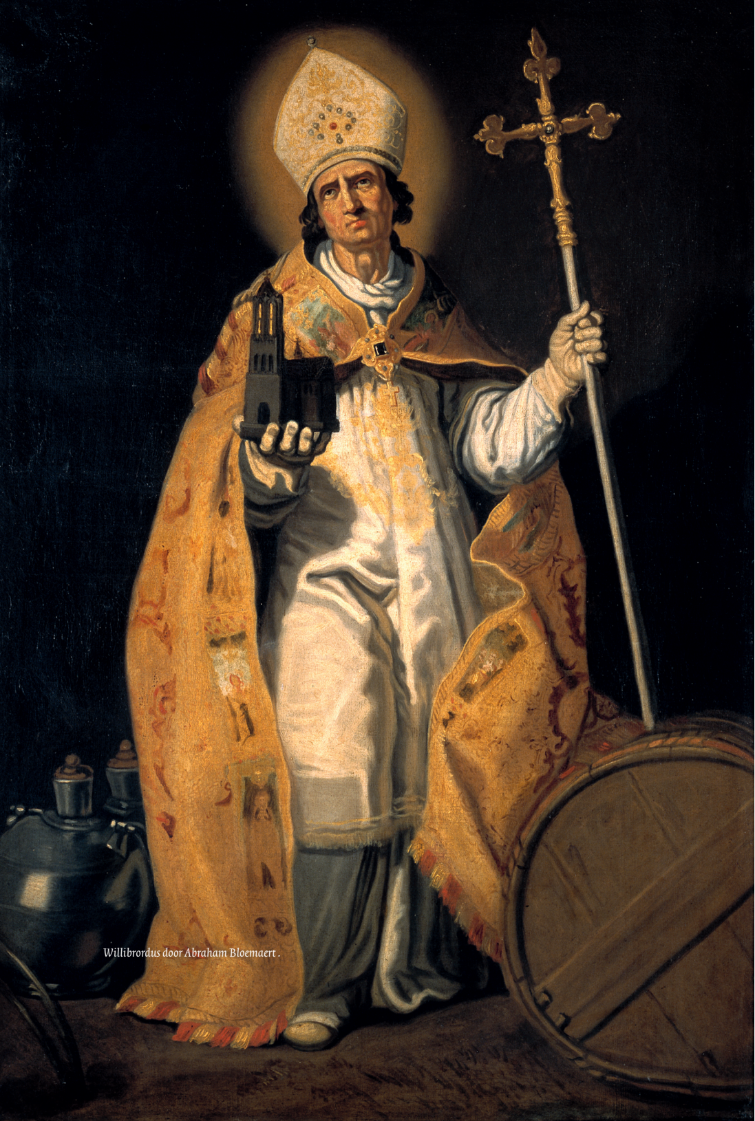
Willibrordus door Abraham Bloemaert.