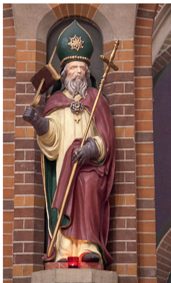
Bonifatius in de Gertrudiskathedraal.

De Oud-Katholieke Kerk van Nederland ziet zichzelf als de rechtstreekse voortzetting van de kerk die in de gebieden van het huidige Nederland rond 700 werd gesticht. Het christendom werd in die periode door Angelsaksische monniken naar de Nederlanden gebracht. Hun leider was Willibrord (658-739), een missionaris uit Northumbrië. Hij werd in 695 door paus Sergius I (687-701) van Rome gewijd tot aartsbisschop van de Friezen met Utrecht als zetel. Hierom wordt Willibrord traditioneel beschouwd als de eerste (aarts)bisschop van Utrecht. Een andere bekende missionaris uit Engeland was Bonifatius (675-754), die enige