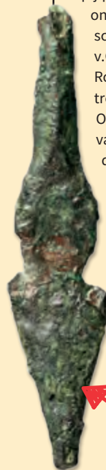
Pijlpunt uit de tiende eeuw voor Christus

Ook zijn er verschillende pijlpunten gevonden, waaronder die van het Babylonische leger (eind 7de eeuw v.Chr.) en van het tiende Romeinse legioen, dat betrokken was bij de Joodse Oorlog en de vernietiging van de zogenoemde tweede tempel in 70 n.Chr. Dit legioen was lange tijd daarna op de Tempelberg gestationeerd.