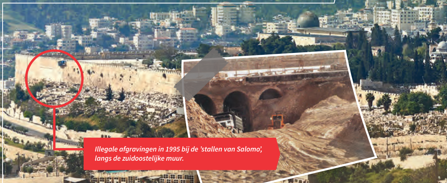
Illegale afgravingen in 1995 bij de 'stallen van Salomo', langs de zuidoostelijke muur.

Aan de voet van de Scopusberg, buiten de stadsmuren van Jeruzalem, staat een kas. Daarbinnen is het warm, ondanks dat het februari is. Tientallen studenten en vrijwilligers zeven er puin, afkomstig van de Tempelberg. Zo af en toe gaat iemand naar buiten om uit te rusten. Even oprispen, handen wassen, koffiedrinken en van het uitzicht genieten. Vanaf hier kun je de gouden koepel op het voormalige Tempelplein goed zien, met daarvoor de lange oostelijke muur van de Oude Stad. Het geratel van de zeefbakken en het gekwebbel van de werkers zijn op de achtergrond hoorbaar. Voordat de hete zomer begint is