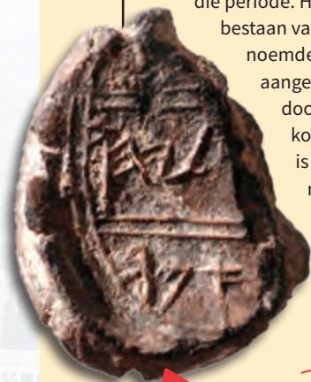
Zegel uit eerste tempelperiode

De spectaculairste vondst tot nu toe is een zegel uit de eerste tempelperiode: 10de-6de eeuw v.Chr. Het bevat een inscriptie waarin een joodse tempelpriester wordt genoemd. Dat wijst op het bestaan van een Israëlitische tempeldienst in Jeruzalem in die periode. Hiermee is het bestaan van de zogenoemde eerste tempel aangetoond, die door Salomo, de koning van Israëel, is gebouwd en rond 950 v.Chr. in gebruik is genomen.